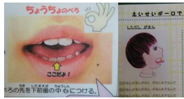
その子に応じた発音指導