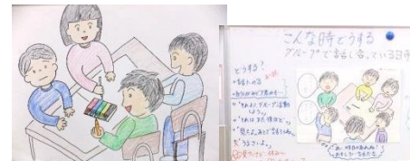
ソーシャルスキルトレーニング