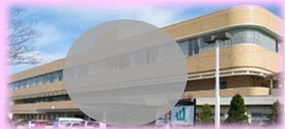
<中心暗転のあくまでもイメージです。>

視野とは、正面を見ている場合に、同時に上下左右などの各方向が見える範囲である。この範囲が、周囲の方から狭くなって中心付近だけが残ったものを求心性視野狭窄、逆に、周囲は見えるが、中心部だけが見えない場所を中心暗転 しゅうあんてん という。