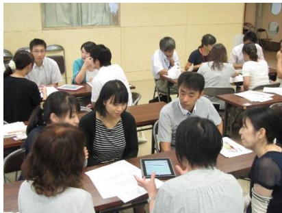
H27 インクルーシブ教育システム構築における合理的配慮と教材・支援機器の活用 演習2「教材支援機器の体験」