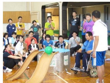
H27 特別支援学校初任者研修宿泊研修(一次研修)「障がい者スポーツの実際」