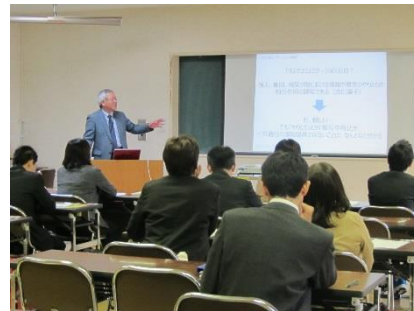
H27 学校教育における安全・防災教育とリスクコミュニケーション 講義「学校教育におけるリスクコミュニケーション」