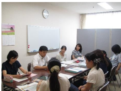
H27 通級指導教室担当教員研修会 協議「通級による指導の実際」