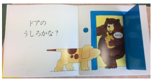
「コロちゃんはどこ？」作・絵：エリック・ヒル（評論社）