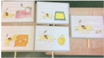
場面ごとのペープサート