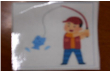
使用した絵カード