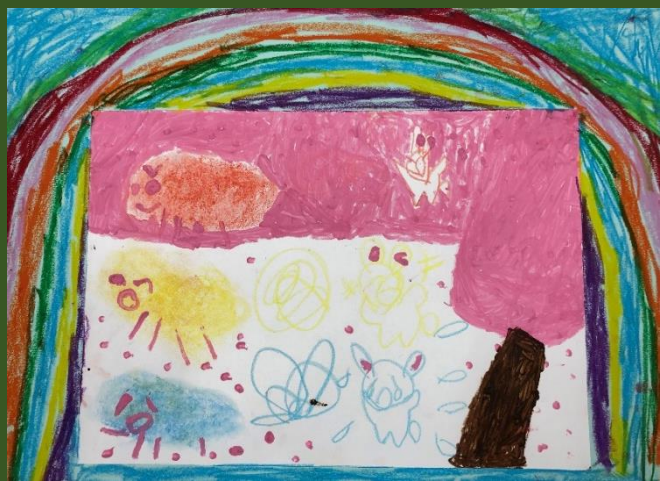
絵画「おこって、わらって、ないて」