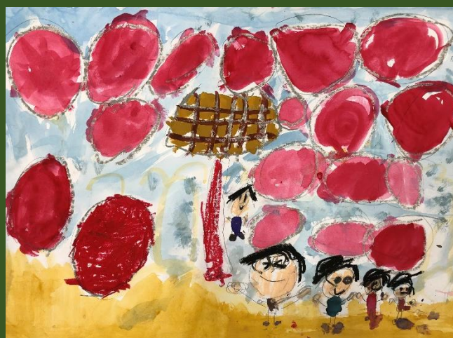
絵画「運動会の思い出」