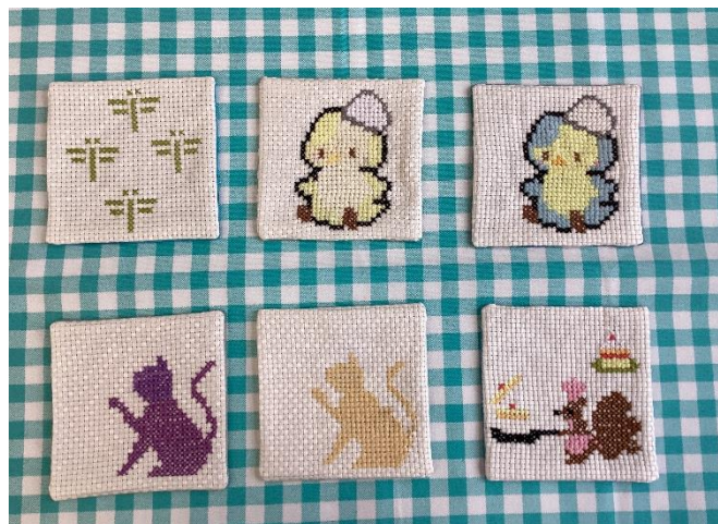
「クロスステッチの技法による、コースターなどの製品」