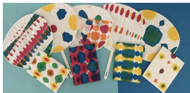
「うちわ、メモ帳」折染め