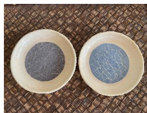
丸皿（掻き落とし模様）