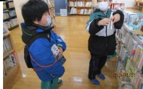
【地域資源を生かした学習活動の様子】