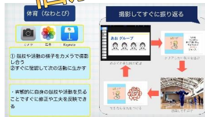
【タブレット端末、実態に応じた学習用プリントの活用】