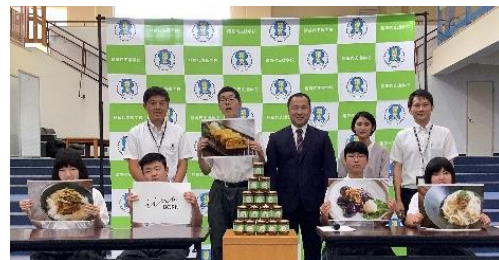
【地域の企業と合同商品開発・販売】