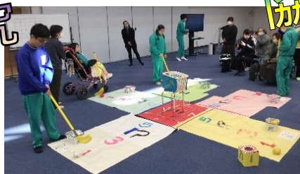
【独自ユニバーサルスポーツの研究】