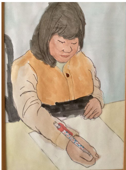
自画像 絵を描く自分