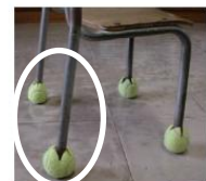
テニスボールを使った緩衝材